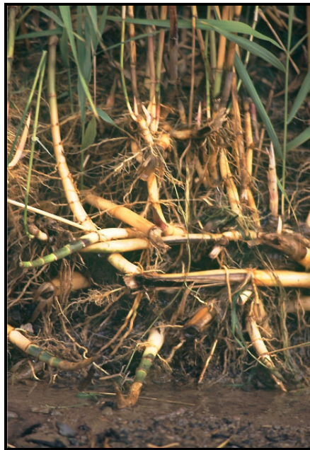
Rhizomgeflecht von Phragmites communis