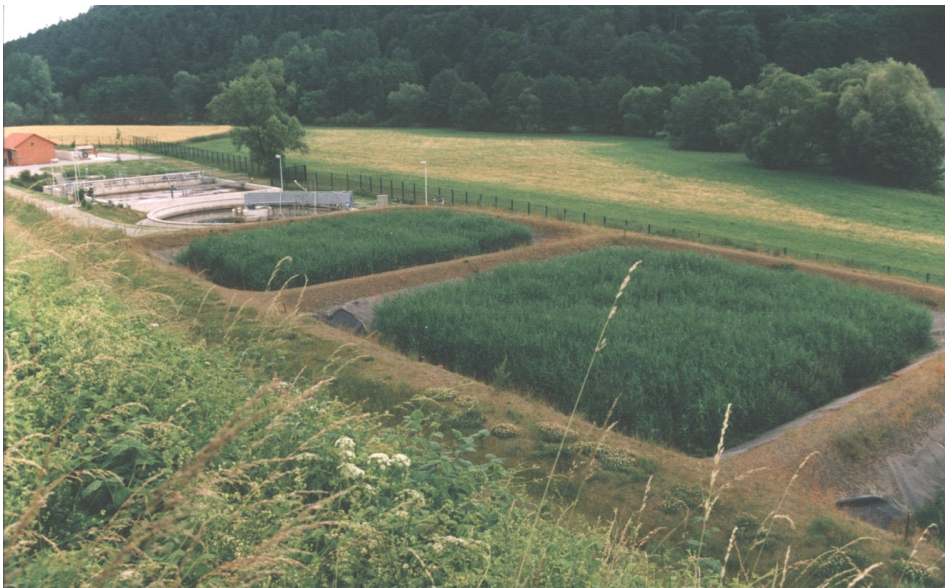
Klärschlammvererdungsanlage Naumburg Teilbeete 1 und 2 (2.400 m 2 Bruttofläche) Wuchshöhe bis 4 m; Halmdichte bis 320 Stück/m 2 , Belebungsanlage im Hintergrund

Klärschlamm wird periodisch auf schilfbepflanzte Vererdungsbecken aufgebracht. Die Pflanzen durchwurzeln und durchwachsen den aufgelandeten Schlamm und bewirken eine beschleunigte Schlammentwässerung und -mineralisierung. Die Wasserabgabe erfolgt über Verdunstung und vor allem über Dränagen, die auf der Sohle der foliengedichteten Becken liegen. Es erfolgt eine Volumenreduzierung der aufgebrachten Nassschlämme um ca. 98 %. Die Schilfbecke werden anlagenspezifisch nach 8 - 12 Jahren erstmals geräumt und anschließend wiederangefahren und weiterbetrieben. Je nach Verwendungszweck kann die Klärschlammmerde dann nachkompostiert, direkt landwirtschaftlich oder thermisch verwertet oder zur Rekultivierung und im Garten- und Landschaftsbau eingesetzt werden.