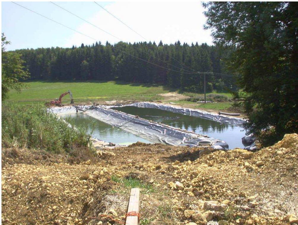
Foto: Becken im Rohbau