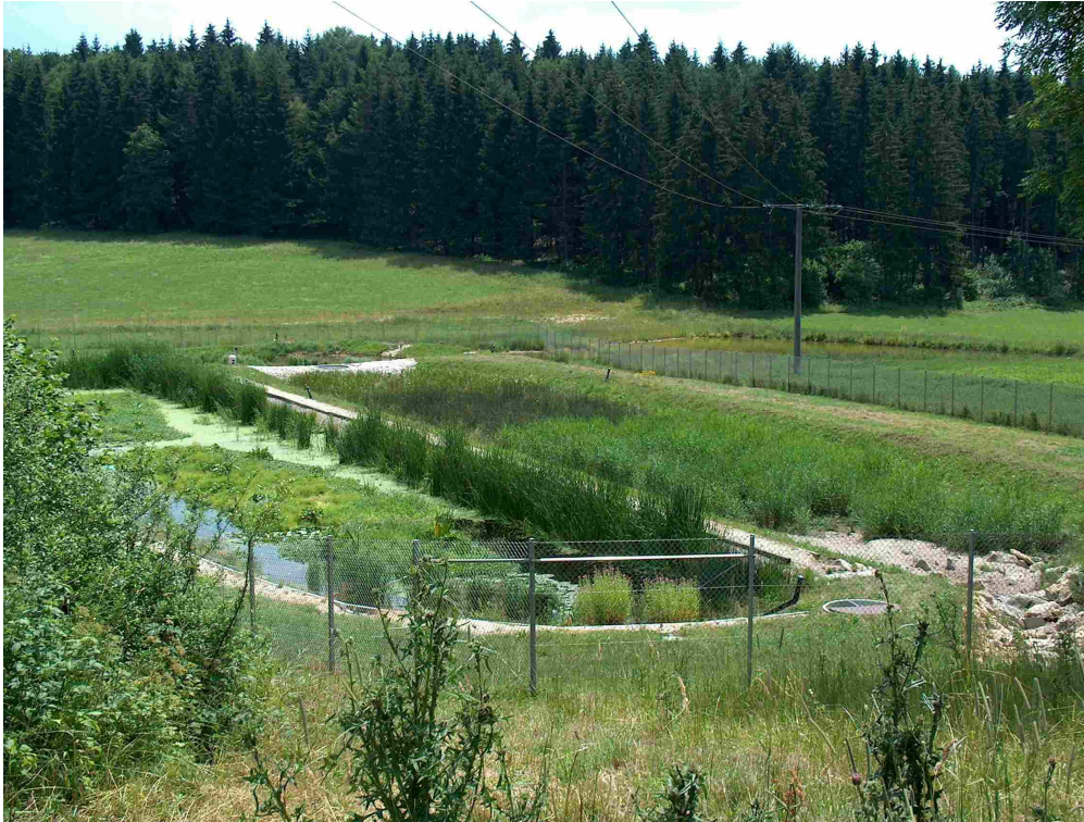
Foto: Anlage im zweiten Betriebsjahr, links Nachklärteich, rechts Retentionsbodenfilter, dahinter Versickerungsareal, im Hintergrund rechts Damm mit Infiltrationsfläche