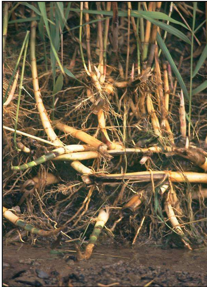
Rhizomgeflecht von Phragmites communis